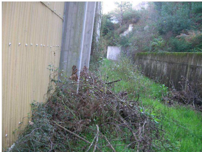
Foto 4 - Vista da fachada oeste do edificio