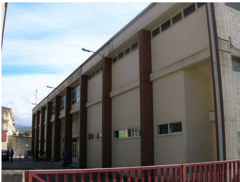
Foto 2 - Vista da fachada este do edificio